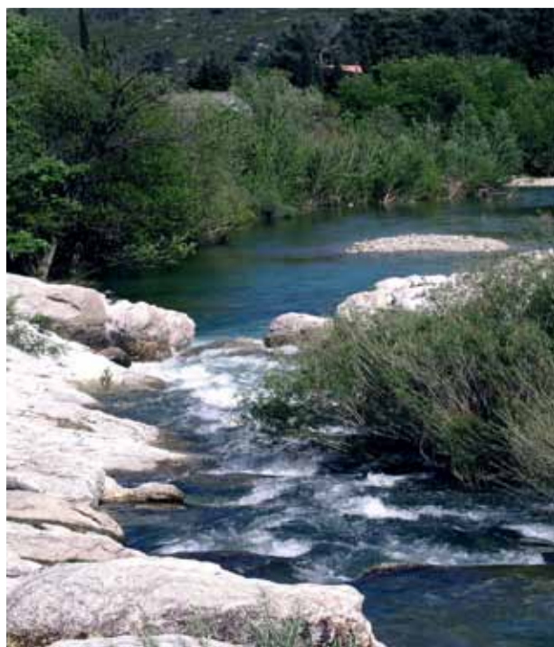
< De Cesse nabij Bize waar de rivier weer opduikt na kilometerslang ondergronds te zijn geweest