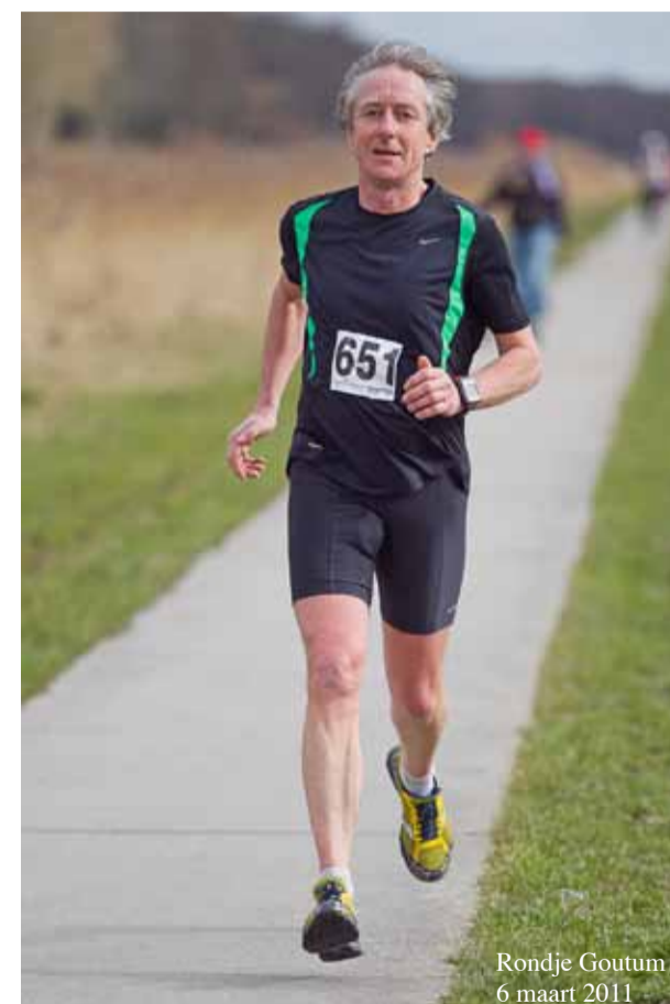
Rondje Goutum 6 maart 2011

Vóór 31 mei 2011 doorgeven aan Cor Wetting via e-mail : info@sprezzatura.org of telefonisch 058-2153412 Wie het eerst komt, het eerst maalt.